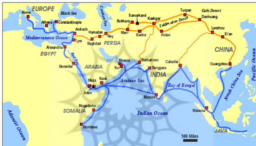
شکل ۲- مسیرهای فرعی جاده ابریشم نوین

اگرچه خط دریایی جاده ابریشم جدید به نوعی مسیر ترانزیتی خلیج فارس را از مسیرهای اصلی کنار می‌گذارد، اما به دلیل جایگاه این منطقه از حیث توزیع انرژی و جریان نقل و انتقال کالاها آن را در قالب مسیرهای فرعی می‌گنجانند (شکل ۲) و از این رو موقعیت ایران در این خط ارتقا می‌یابد؛ اما در خط زمینی، ایران به مثابه پل بزرگی میان شرق و غرب دارای اهمیت بوده و در صورت توجه به ویژگی‌های سیاسی و اقتصادی این دیپلماسی از جانب چین، ایران می‌تواند از جایگاه به مراتب مهم‌تری نسبت به قبل برخوردار شود.