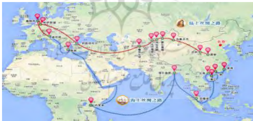
شکل ۱- مسیرهای اصلی جاده ابریشم نوین

خط ممتد سرزمینی (قرمز): جاده ابریشم زمینی نوین خط ممتد دریایی (آبی): جاده ابریشم دریایی نوین