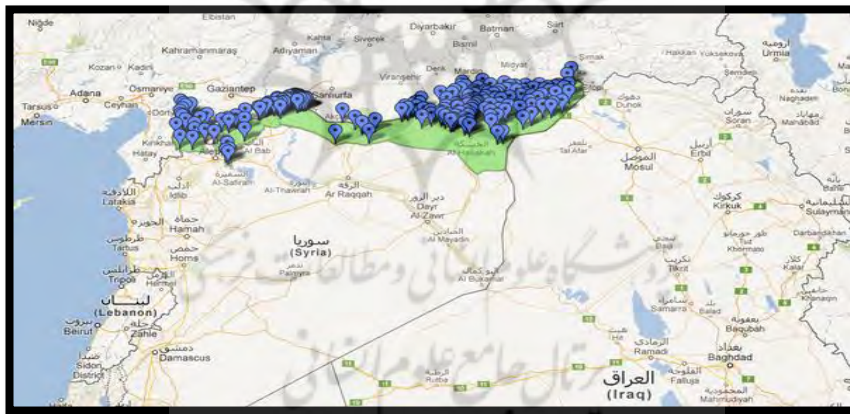
شکل شماره (۲). اقلیم مورد نظر کردهای سوریه برای ایجاد ایالتی فدرال

کردهای سوریه با توجه به ظرفیت‌ها و امکاناتی که در اختیار دارند، طی یک سال اخیر طرح ایجاد ایالتی خودمختار و یا فدرال همانند اقلیم کردستان عراق را در نواحی کردنشین سوریه پیگیری می‌کنند. براساس نقشه مورد نظر، کردهای سوریه در پی برپایی ایالتی مستقل هستند که مرزهای آن از روستای «عین دیوار» که در محدوده شهر دیرک، که یکی از شهرهای استان حسکه است، شروع می‌شود و همجوار با مرزهای ترکیه به سمت غرب در ناحیه اسکندرون خاتمه پیدا می‌کند. شکل زیر نمایان‌گر محدوده جغرافیایی مورد نظر کردها و نحوه پراکندگی جمعیت آنان، در ایالت مورد نظرشان است.