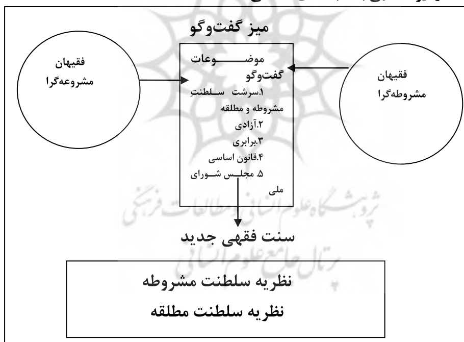
شکل (۱) فرآیند تولید نظام سیاسی جدید از سنت فقهی