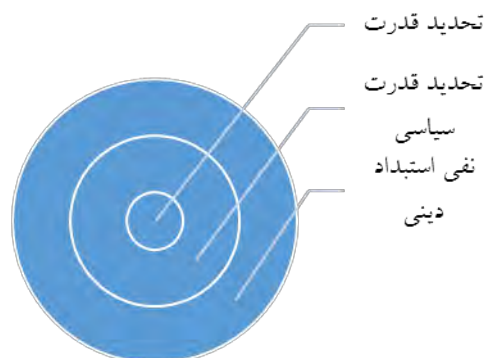
شکل (۳): عناصر وضعیتی مشروطه مشروعه

نظریه‌ای را در فقه شیعه سامان دادند که به نام «سلطنت مشروطه» شناخته شد.