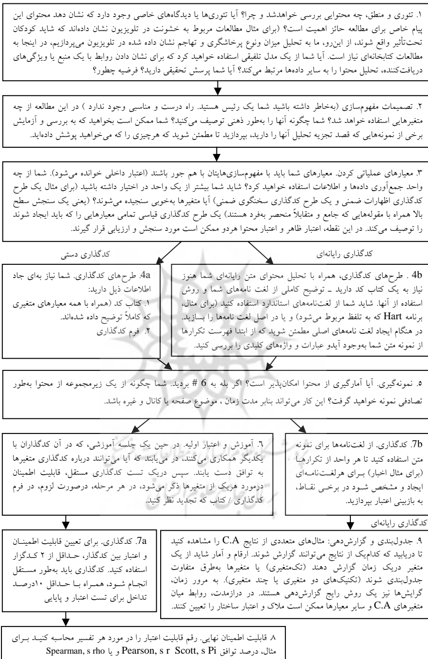
شکل ۱ فلوچارت فرایند خاص تحقیق تحلیل محتوا