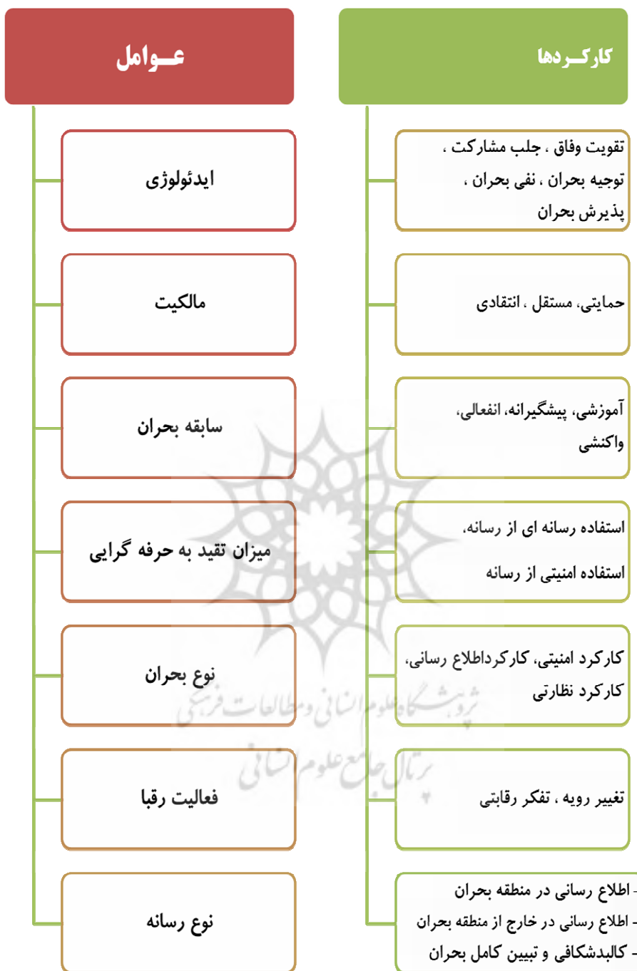
شکل ۴ چگونگی اثرپذیری کارکردهای رسانه از عوامل متعدد