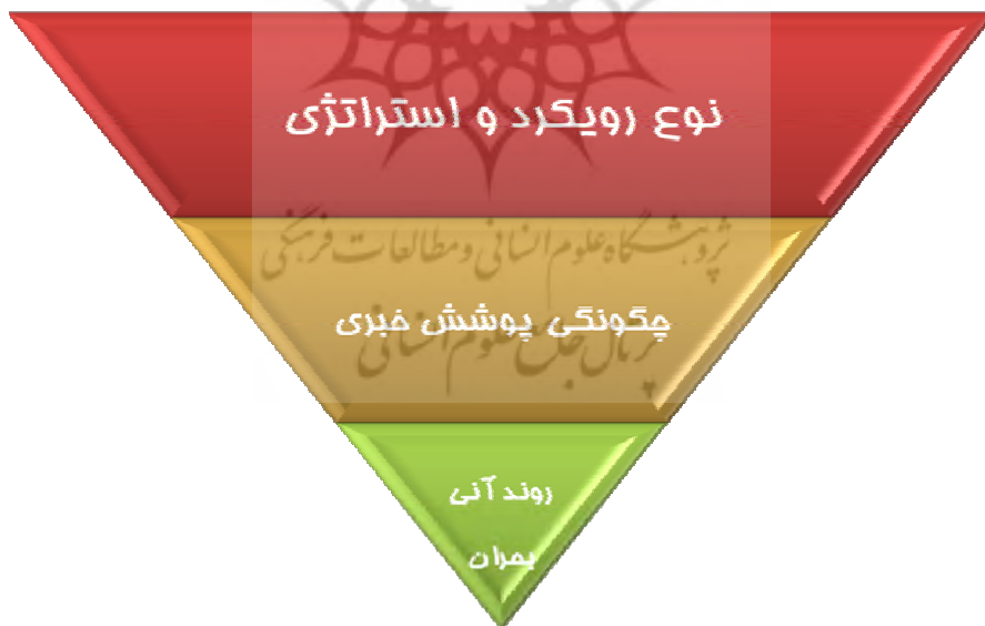
شکل ۳ تأثیر نوع رویکرد و استراتژی رسانه‌ای بر روند بحران

نوع رویکرد و استراتژی، جهت‌گیری رسانه را در برنامه‌ریزی و چگونگی پوشش بحران تعیین می‌کند به عبارت دیگر میزان اعتقاد و ایمان به هریک از رویکردها و استراتژی‌ها، تعیین‌کننده نوع حرکت و جهت‌گیری رسانه‌ها در بحران است و بی‌تردید تولید و انتشار اخبار در بحران متأثر از نوع نگاه دست‌اندرکاران رسانه و راهبردها و رویکردشان به آن است. به عنوان مثال اگر رویکرد رسانه به بحران سنتی و مخالفت با بحران و استراتژی آن نیز واکنشی یا انفعالی باشد، به بحران و نیاز مخاطبان در این زمینه بی‌توجه و متأثر از همین استراتژی و رویکرد، جهت‌گیری رسانه نیز حمایتی خواهد بود. برعکس اگر رویکردها به بحران تعاملی و موافقت با بحران باشد، استراتژی رسانه مثبت و فرصت‌طلبانه و جهت‌گیری آن مستقل و انتقادی خواهد بود و رسانه سعی خواهد کرد ابعاد و زوایای مختلف بحران را پوشش دهد و از رسانه‌های رقیب نیز در این زمینه پیشی گیرد. همچنین اگر رویکرد رسانه به بحران از نوع قانون طبیعی باشد، نوع عمل رسانه در بحران‌ها واکنشی خواهد بود. بنابراین، نوع رویکرد و استراتژی، جهت‌گیری رسانه و چگونگی پوشش خبری بحران را تعیین می‌کند و چگونگی پوشش خبری بحران (تسریع در انتشار، تحدید اطلاع‌رسانی، انتشار جامع) نیز بر روند آتی بحران و خسارت‌های ناشی از آن تأثیر غیر قابل انکاری دارد.