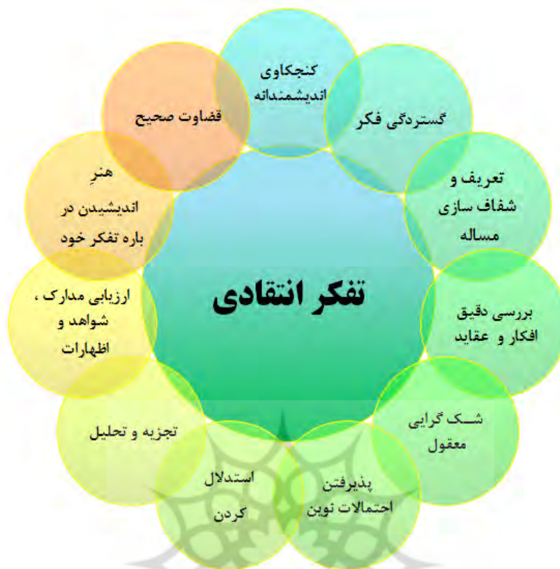
شکل ۱: مؤلفه‌های یازده گانه تفکر انتقادی بر اساس مبانی نظری پژوهش

در رابطه با جایگاه تفکر انتقادی در کتاب درسی تاریخ معاصر ایران در مقطع متوسطه، تحقیق و یا پژوهشی که به‌طور مستقیم به این موضوع پرداخته باشد، یافت نشد اما درعین حال تحقیقات مختلفی درباره‌ی جایگاه تفکر انتقادی در دروس، پایه‌ها و مقاطع دیگر انجام شده که در اینجا به برخی از آنها اشاره می‌شود: