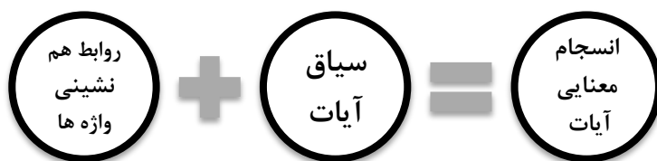
شکل ۲- الگوی کشف انسجام معنایی آیات

رابطه پیوستگی و انسجام بین اجزای یک متن معیار و عنصری مهم در یافتن مفاهیم موجود در متن است. بنابراین وابستگی و دلالت هریک از این عناصر بر یکدیگر به گونه‌ای که بدون توسل به یکدیگر متن به طور مناسب قابل درک نیست. اما صرف روابط هم‌نشینی منجر به کشف پیوستگی در آیات نیست. بنابراین احراز شروط تحقق سیاق از جمله وحدت موضوعی و پیوستگی نزولی لازم است (ر.ک: بابایی و همکاران، ۱۳۸۵، مبحث سیاق) این روش در شکل ۲- نشان داده شده است.