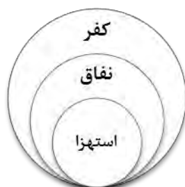
شکل ۳- شمول معنایی کفر و نفاق با استهزا

محور اصلی مورد بررسی در این بخش روابط هم‌نشینی واژه‌ها در آیات است. با استفاده از این روش می‌توان هریک از اجزای یک متن را شناخت. از بررسی هم‌نشین‌های استهزا در آیات به مهم‌ترین هم‌نشین‌های استهزا که کفر و نفاق هستند، رسیدیم. ارتباط این دو واژه با استهزا، کل به جزء است. در واقع استهزا یکی از اجزای کفر و نفاق است. زیرا کفر و نفاق در دایره معنایی خود وسعت و شمول بیشتری نسبت به سایر واژگان دارند و واژه‌های محوری در گفتمان قرآن محسوب می‌شوند. در شکل ۳ نشان داده شده است.