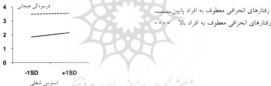
شکل ۳: نمودار رابطه استرس شغلی با فرسودگی هیجانی با رفتارهای انحرافی معطوف به افراد پایین و بالا

چنان که در جدول ۳ مشاهده می‌شود، در بلوک اول که استرس شغلی برای پیش‌بینی فرسودگی هیجانی وارد معادله پیش‌بین شده، توانسته با ضریب بتای استاندارد برابر با 0/42 ، 17/3 درصد واریانس تبیین شده برای پیش‌بینی فرسودگی هیجانی به وجود آورد. در بلوک دوم که رفتارهای انحرافی معطوف به افراد در کنار استرس شغلی برای پیش‌بینی فرسودگی هیجانی اضافه شده، رفتارهای انحرافی معطوف به افراد توانسته با ضریب بتای استاندارد برابر با 0/64 ، 35/7 درصد واریانس افزوده معنادار برای پیش‌بینی فرسودگی هیجانی پدید آورد. در بلوک سوم (اثرات اصلی + تعامل‌ها) پس از افزوده شدن رابطه تعاملی رفتارهای انحرافی معطوف به افراد و استرس شغلی، این تعامل با ضرایب بتای استاندارد برابر با 0/11 - توانسته حدود 1 درصد ( 0/9 درصد) واریانس افزوده تبیین شده معنادار برای پیش‌بینی فرسودگی هیجانی پدید آورد. این تعامل معنادار به این معنی است که در سطوح بالا و پایین رفتارهای انحرافی معطوف به افراد رابطه احساس استرس شغلی با فرسودگی هیجانی متفاوت است. در نمودار ۳ تحلیل ساده شیب خط (رابطه استرس شغلی با فرسودگی هیجانی) در رفتارهای انحرافی معطوف به افراد بالا و پایین را مشاهده می‌کنید.