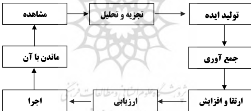
شکل ۱۰-۱-۲: مدل تلفیقی فرآیند خلاقیت (مارک، ۱۳۷۰)

تا به حال مدل‌های زیادی برای خلاقیت ارایه شده اما در اینجا به اولین مدل که پایه و اساس کلیه مدل‌هاست و آخرین مدل که مدلی تلفیقی از سایر مدل‌هاست اکتفا می‌کنیم. مدل گراهام والاس، ۱۹۶۲: این مدل شامل مراحل دوره آمادگی، دوره خواب (پرورش)، دوره روشنایی (بصیرت)، دوره آزمایش و ارزش گذاری می‌شود (صمد آقایی، ۱۳۸۰: ۱). مدل تلفیقی فرآیند خلاقیت پائول پلسک، ۱۹۹۶: این مدل را می‌توان به صورت شکل زیر نمایش داد: