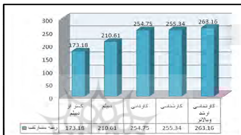
شکل شماره (۳): رتبه مشارکت بر حسب سطح تحصیلات

نیز بیشتر می‌شود. در پژوهش‌های گلیرز، لایب سول و ساکروت نیز این مسئله تأیید شده است. علت اصلی این امر، آشنایی بیشتر و کامل‌تر افراد تحصیل کرده با ابعاد اجتماعی، اقتصادی، فرهنگی و کالبدی مشارکت است. از این رو، فراهم نمودن شرایط و امکانات مناسب به منظور افزایش سطح تحصیلات در بین روستاییان و همزمان بالا بردن آگاهی‌ها و دانش روستاییان در قالب برگزاری کلاس‌های آموزشی، اقدامی مؤثر در جهت افزایش و ترغیب روستاییان به منظور پذیرش مشارکت در برنامه‌های توسعه روستایی خواهد بود (شکل ۳).