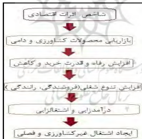
شکل شماره (۱): مدل مفهومی اثرات اقتصادی شهرک صنعتی آق قلا

صنعتی‌سازی نواحی روستایی باشد (دریان‌آستانه، ۱۳۸۳: ۷۷). نواحی صنعتی موجب افزایش درآمد روستاییان و کاهش اختلاف درآمد بین شهرنشینان و روستاییان گردیده (Sunder, 2009: 28-29) و میان آن‌ها پیوند ایجاد می‌کند؛ همچنین صنایع روستایی به تحکیم الگوی عدم تمرکز صنایع می‌انجامد (Walker, 2007: 3). با توجه به رشد بالای جمعیت و محدودیت زمین کشاورزی، صنایع روستایی می‌تواند با ایجاد فرصت‌های شغلی جدید نسبت قابل قبولی از نیروی کار را جذب نموده و آهنگ رشد نرخ بیکاری را کاهش دهد و زمینه را برای توسعه روستاها هموارتر سازد (Maran, 2007: 86). صنعت علاوه بر افزایش نرخ اشتغال، به‌عنوان یکی از بخش‌های غیرکشاورزی، منجر به افزایش درآمدهای غیرمحلی گردیده و به صورت مستقیم و غیرمستقیم در مدرنیزاسیون بخش کشاورزی نیز نقش عمده‌ای دارد (Das, 2009: 1). صنعتی‌سازی روستاها منجر به تحول در اقتصاد روستایی گردیده و با جذب قسمتی از جمعیت روستا، تا حدی مشکل بیکاری را مرتفع نموده است (Sunder, 2009: 29)؛ همچنین با برقراری پیوند با کشاورزی، موجبات رشد آن را فراهم می‌آورد (Hwa, 1989: 45). به همین دلیل صنعتی شدن جایگاه مهمی در راهبردها و سیاست‌های کشورهای در حال توسعه دارد (Dutta, 2004: 334). استقرار صنایع در روستا قادر است فرصت‌های شغلی و درآمدی بیشتر ایجاد کند و از این رو بستر مناسبی برای توسعه روستایی به‌شمار می‌آید (حاجی‌نژاد، ۱۳۸۵: ۲۰).