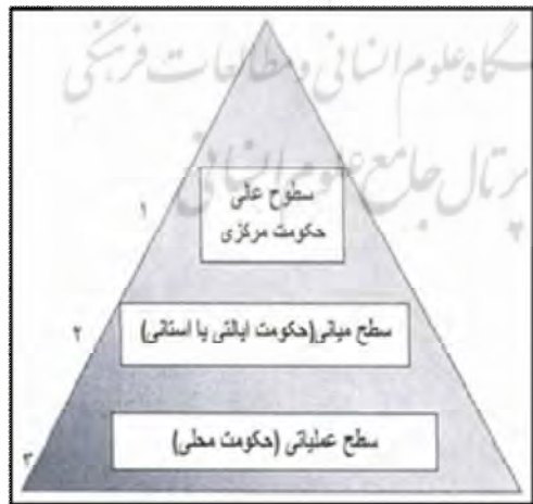
شکل شماره (۲): حوزه عملکرد شوراهای ایران (نصر، همان)