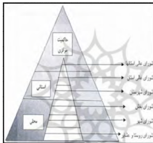
شکل شماره (۱): سه سطح حاکمیت (مقیمی، ۱۳۸۵: ۱۸)

ایجاد حسن مشارکت و مسئولیت پذیری در حوزه زندگی روستا و ده نقش بزرگی داشته باشد (نصر، ۱۳۸۹: ۱۰۱). همچنین در شرح وظایف شوراهای همکار، پیشنهاد، مراقبت، جلب مشارکت، پیگیری و امثال آن به چشم می خورد که از آنها نمی توان مفهوم تصمیم گیری و مدیریت امور محلی مکان و منطقه جغرافیایی را دریافت (حافظ نیا، ۱۳۸۱: ۴۵۸). الگوی شوراهای ایران در مقایسه با حاکمیت های محلی دیگر کشورهای جهان از ویژگی خاصی برخوردار می باشد به گونه ای که چنین ساختاری را در کشورهای دیگر نمی توان یافت.