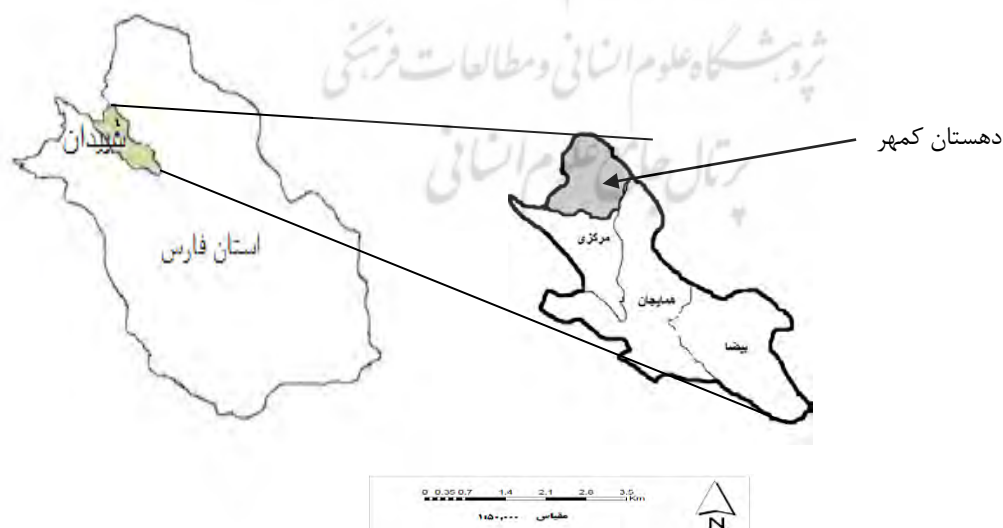
شکل ۱: موقعیت جغرافیایی منطقه مورد مطالعه، شهرستان سپیدان، دهستان کمهر