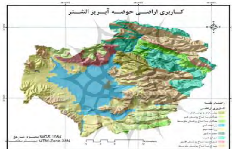
شکل ۳: وضعیت کاربری اراضی در سطح حوضه آبریز الشتر

از آنجا که در پژوهش حاضر بررسی وضعیت فرسایش حوضه و ارتباط آن با وضعیت آینده توسعه کشاورزی و، به تبع آن، توسعه سکونتگاه‌های روستایی حوضه آبریز الشتر ملاحظه شده است، پس از پهنه‌بندی فرسایش در سطح حوضه و تعیین کلاس‌های فرسایش با هم‌پوشانی لایه‌ی نقاط روستایی و شهری محدودی حوضه و انطباق کلاس‌های فرسایش با وضعیت موجود کاربری اراضی شرایط هرکدام از کاربری‌ها (جدول ۴) در سطح حوضه بررسی شد و نتایج ذیل به دست آمد: از مجموع ۲۰۸ نقطه‌ی روستایی در سطح حوضه، ۲۵ نقطه (معادل ۱۲/۰۱) درصد از نقاط روستایی در کلاس فرسایش IV و V، ۸۴ نقطه (معادل ۴۰/۳۸ درصد) در کلاس فرسایش II، ۹۸ نقطه (معادل ۴۷/۱۱ درصد) در کلاس فرسایش I، و سرانجام، ۱ نقطه (معادل ۰/۴۸ درصد) در کلاس فرسایش III قرار گرفته‌اند. به عبارت دیگر، ۸۸/۷۶ درصد نقاط روستایی در وضعیت مناسبی به لحاظ فرسایش هستند.