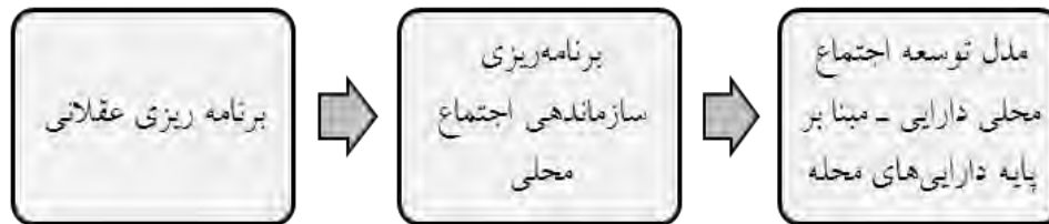
شکل ۱- طیف تکاملی مدل‌های برنامه‌ریزی محله‌ای