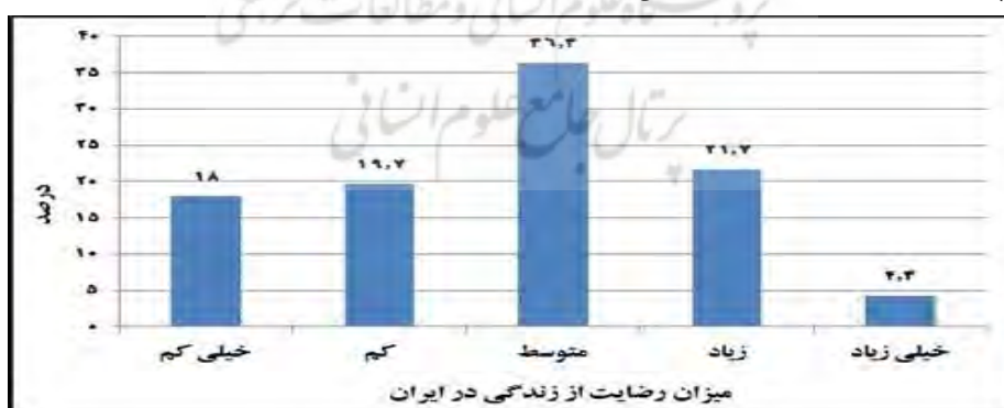
شکل ۴: نمودار توزیع پاسخگویان بر حسب میزان رضایت از زندگی در ایران

در بررسی میزان رضایت پاسخگویان از زندگی در ایران مشخص گردید که تقریباً ۳۸ درصد پاسخگویان رضایت کم و خیلی کمی از زندگی در ایران داشته‌اند. ۲۶ درصد پاسخگویان هم میزان رضایت زیاد و خیلی زیاد را انتخاب کرده‌اند. در مجموع می‌توان گفت که میزان رضایت کم و خیلی کمی در مقایسه با میزان رضایت زیاد و خیلی زیاد سهم بیشتری از نظر پاسخگویان را به خود اختصاص داده است.