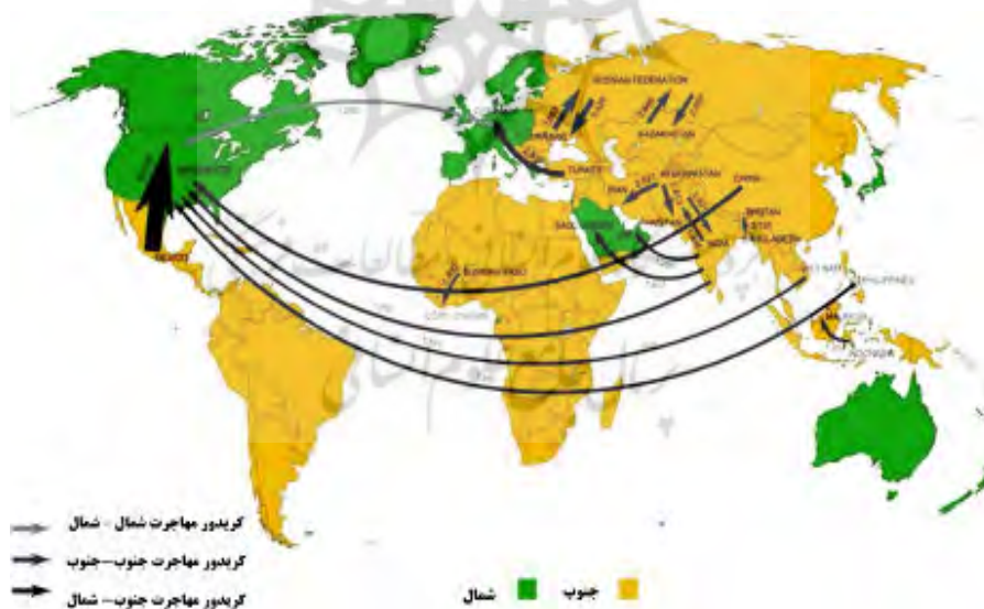
شکل ۲: بیست مسیر اصلی مهاجرت در جهان (IOM calculation, based on UN, DESA 2010).

بر اساس سرشماری عمومی نفوس و مسکن در سال ۱۳۸۵ تعداد مهاجرین افغانستانی در ایران برابر با ۱۲۱۱۱۷۱ نفر بوده است که در سال ۱۳۹۰ این رقم به ۱۴۵۲۵۱۳ نفر افزایش یافته است. همچنان که در نقشه زیر دیده می‌شود، مهاجرت از افغانستان به ایران یکی از بیست مسیر اصلی مهاجرت در جهان تبدیل شده است.