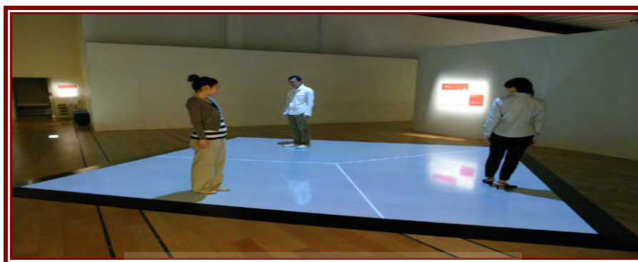
شکل ۱: مرزبندی بین انسان‌ها

توان گفت انسان‌ها در زمینه‌های مختلف معنوی و مادی با یکدیگر تفاوت دارند و این تفاوت سبب شکل دادن به مرزبندی بین آن‌ها می‌شود (شکل (۱)) (حافظنیا و جان‌پور، ۱۳۹۲: ۲۸-۲۷).