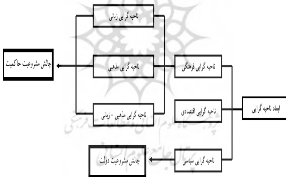
شکل ۱- گونه‌شناسی ناحیه‌گرایی

سیاسی متفاوتی نسبت به مرکز دارند را می‌توان در زمره نواحی ناحیه‌گرا به شمار آورد (Dikshit, 1994: 169). ناحیه‌گرایی در کلیت خود نشان‌دهنده وجود بحران است که مشروعیت نظام سیاسی و دولت را دست‌کم در مقیاس ناحیه‌ای به چالش می‌کشاند. عوامل و عناصری که موجودیت ناحیه‌گرایی را در یک واحد سیاسی به وجود می‌آورد، تابعی از شرایط، خصوصیات و ویژگی‌های منحصر به فرد آن ناحیه خواهد بود. به عبارت دیگر، نیروی اولیه حرکت یک جنبش ناحیه‌گرایانه در تمامی کشورهایدرگیر با این پدیده یکسان نیست؛ زیرا خاستگاه آن در هر واحد سیاسی یکسان نبوده و تابعی از شدت و توان یکی از گونه‌های این پدیده و یا در بعضی موارد همه‌آنها بوده است. با توجه به این نوشتار، ناحیه‌گرایی ابعاد مختلفی را در بر می‌گیرد که هرکدام از این ابعاد، معرف و شناساننده ماهیت وجودی فعالیت‌های ناحیه‌گرایانه است. بر این اساس، گونه‌شناسی ناحیه‌گرایی عبارتند از: ۱- ناحیه‌گرایی فرهنگی ۲- ناحیه‌گرایی اقتصادی ۳- ناحیه‌گرایی سیاسی.