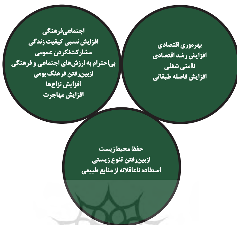
تصویر ۳. الگوی ابعاد توسعه پایدار گردشگری در روستای آهار.