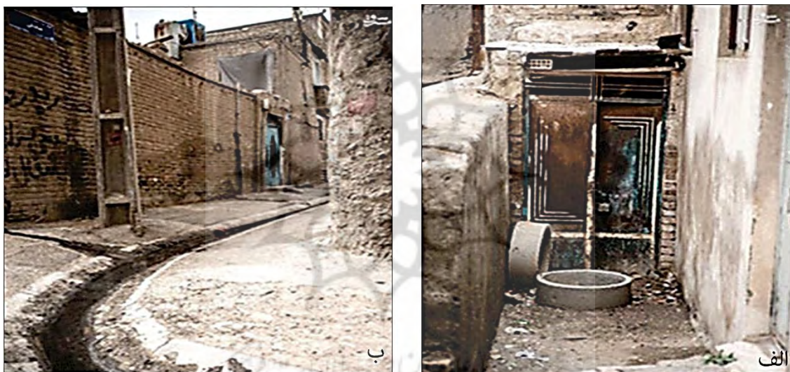
شکل ۲. نمایی از وضعیت کالبدی محلّه نرفآباد؛

قدمت بالای محلّه، در نابسامانی کالبدی این بافت نقش مؤثر دارد. فرسودگی، ویژگی بارز فضای کالبدی محلّه است. بیشتر خانه‌های آن قدیمی، با کوچه‌های تنگ و باریک است. نمایی از وضعیت کالبدی محلّه نرفآباد در شکل ۲ مشاهده می‌شود.