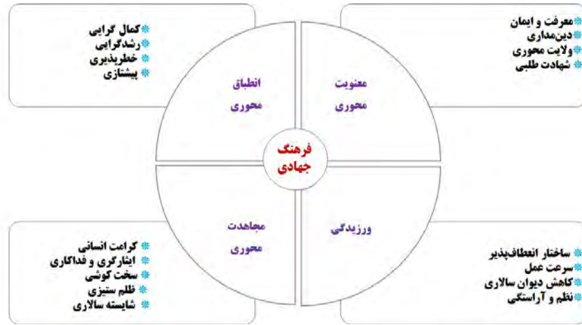
نمودار ۲. فرهنگ جهادی یکی از نهادهای انقلاب اسلامی (محقق ساخته، ۱۳۹۴)

فرهنگ جهادی که به ساحت درونی سازمان اشاره دارد، بر ارزش‌های محوری، جوهری و اساسی که منبعث از مبانی دینی و اسلامی است، تأکید می‌ورزد. در طراحی این نمونه بر اساس افزار تحلیلی شناخت سازمان و متناظر با ابعاد فوق‌الذکر، چهار مؤلفه فرهنگ جهادی: الف) مؤلفه معنویت محوری متناظر با بعد معنایی؛ ب) مؤلفه ورزیدگی متناظر با بعد ساختاری؛ ج) مؤلفه مجاهدت محوری متناظر با بعد رفتاری و د) مؤلفه انطباق محوری متناظر با بعد زمینه‌ای، مورد شناسایی قرار گرفت.