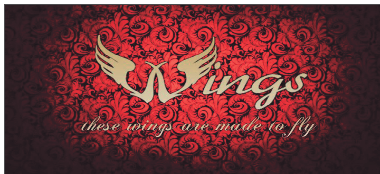
تصویر شماره ۵- نشان گروه وینگز

سال اخیر کشیده شده است. گروه وینگز ۱ با شعار «بال‌هایی که پرواز می‌کنند و لب‌هایی که ترانه می‌خوانند و اندیشه‌هایی که مانند یک پرنده آزاد برفراز آسمان موسیقی هستند این "وینگز" است. ۲ »، در سال گذشته اولین کاور خود را با چند عضو منتشر کرده است. این گروه که متشکل از چند دختر و پسر جوان ایرانی است تاکنون یک آهنگ به نام "سرد است" از گروه اپیک‌های ۳ را خوانده است.