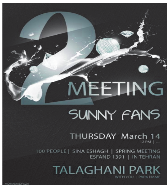
تصویر شماره ۳- پوستر میتینگ هواداران موسیقی پاپ کره‌ای ایرانی

کره‌ای در زمینه پاپ و سریال‌های کره‌ای و دیگر مراسم و برنامه‌های تلویزیونی کره جنوبی می‌پردازد. این سایت با فعالیت‌هایی چون ارائه اطلاعات کلیدی در مورد زندگی شخصی و شغلی ستاره‌ها و ارائه زیرنویس‌های فارسی نقشی اساسی در کمرنگ کردن فاصله‌های فرهنگی میان دو کشور دارد. این سایت که مجموعه فعالیت‌های گسترده‌ای در زمینه علاقه‌مندان فرهنگ کره‌ای در ایران سامان‌دهی می‌کند، علاوه بر فعالیت‌های رسانه‌ای در فضای مجازی در سال‌های اخیر دیدارهایی نیز برای آشنا کردن طرفداران فرهنگ کره‌ای در ایران نیز ترتیب داده است. پوستر زیر نمونه‌ای از دعوت علاقه‌مندان تهرانی برای ملاقات در پارک طالقانی است.