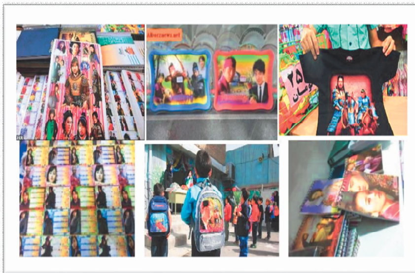
تصویر شماره ۲- نمونه‌ای از وسایل با نشان ستاره‌های کره‌ای در ایران

اما نکته قابل توجهی که محققان این مقاله را به سمت بررسی چگونگی طرفداری از گروه‌های خارجی و نه ایرانی به‌ویژه موسیقی و درام ۱ کره‌ای در ایران تشویق کرده، ماهیت متفاوت طرفداران در فضای مجازی است. ماهیتی که ممکن است در میان جوانان کشورهای متفاوت که تجربه آن‌ها از لذت مصرف محصولات فرهنگی فراملی خودشان به میزان زیادی با فضای غیرواقعی و مجازی گره خورده است، مشابه باشد. با توجه به مشاهدات پژوهشگران، تجربه دوستداران موسیقی پاپ کره‌ای ۲ و پاپ ژاپنی ۳ در ایران به علت وابستگی تقریباً کامل آن به فضای مجازی، تجربه‌ای خاص، به درجه زیادی تخیلی و به میزان زیادی وابسته به فضای مجازی است (دسترسی به آلبوم‌ها،