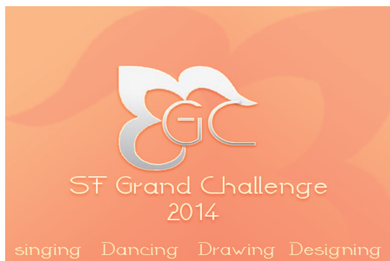
تصویر شماره ۴- پوستر رقابت هواداران ایرانی پاپ و سریال‌های کره‌ای

هم‌چنین این سایت در رأی‌گیری‌های انجام شده در سایت ام‌نت ۱ - سایت معتبر در مورد رخدادهای فرهنگی کشور کره به زبان انگلیسی و کره‌ای - اولین سایت هواداری از پاپ کره‌ای، در منطقه خاورمیانه شناخته شده است. مجموعه سانی فنز گاهی برای ایجاد هم‌دلی و هم‌چنین ایجاد رقابتی دل‌نشین مابین اعضای خود به برگزاری مسابقاتی مابین افراد حقیقی و یا مدیران سایت‌های هواداری ایرانی دست می‌زند.