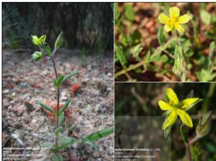
شکل ۴- تصویر گونه Helianthemum ledifolium