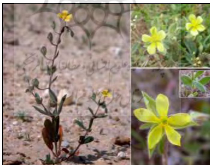
شکل ۵- تصویر گونه HELIANTHEMUM SALICIFOLIUM