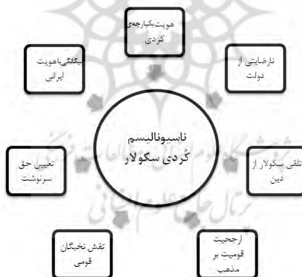
مدل (۱): مدل زمینه‌ای درک و تفسیر کردهای سنی از پدیده قوم‌گرایی

ابعاد مختلف قوم‌گرایی برای هر کدام از این دو گروه در مدل‌های (۱) و (۲) نشان داده شده است. در ادامه نیز تفاوت‌ها و تشابهات قوم‌گرایی میان این دو گروه که در جدول (۴) آمده است، توضیح داده می‌شود.