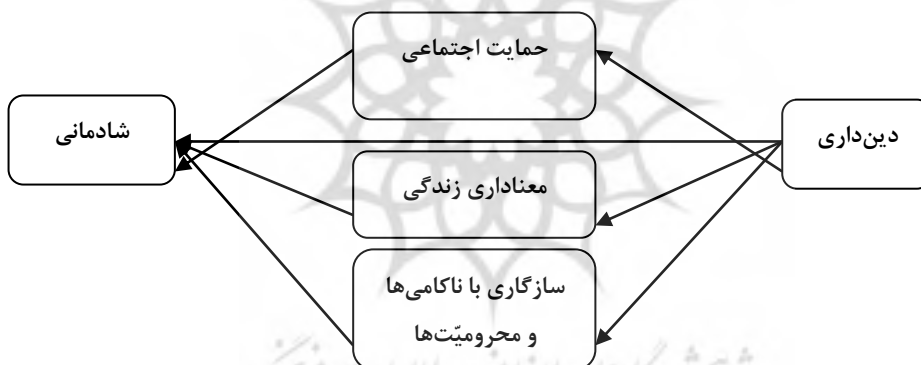
شکل ۱- مدل نظری ارتباط بین متغیرها

همان‌طور که در مرور نظریه‌ها مشخص شد، دین‌داری با افزایش حمایت اجتماعی و نیز با معنادار ساختن زندگی فرد و تقویت آمادگی روانی و اجتماعی او برای مواجهه با ناکامی‌ها و محرومیت‌ها، موجب تقویت شادمانی افراد می‌شود. مدل نظری تحقیق بر اساس همین روابط ترسیم شده است (شکل ۱). بر مبنای این مدل فرضیه‌های تحقیق عبارتند از: ۱. هرچه دین‌داری افراد بیشتر باشد، حمایت اجتماعی آن‌ها بیشتر است. ۲. هر چه حمایت اجتماعی افراد بیشتر باشد، شادمانی آن‌ها بیشتر است. ۳. هرچه دین‌داری افراد بیشتر باشد زندگی آن‌ها معنادارتر است. ۴. هرچه زندگی افراد معنادارتر باشد، شادمانی آن‌ها بیشتر است. ۵. هرچه دین‌داری افراد بیشتر باشد، بیشتر با ناکامی‌ها و محرومیت‌ها کنار می‌آیند. ۶. هر چه سازگاری انسان با محرومیت‌ها و ناکامی‌ها بیشتر باشد، شادمان‌تر است. ۷. هر چه دین‌داری افراد بیشتر باشد، شادمانی آن‌ها بیشتر است.