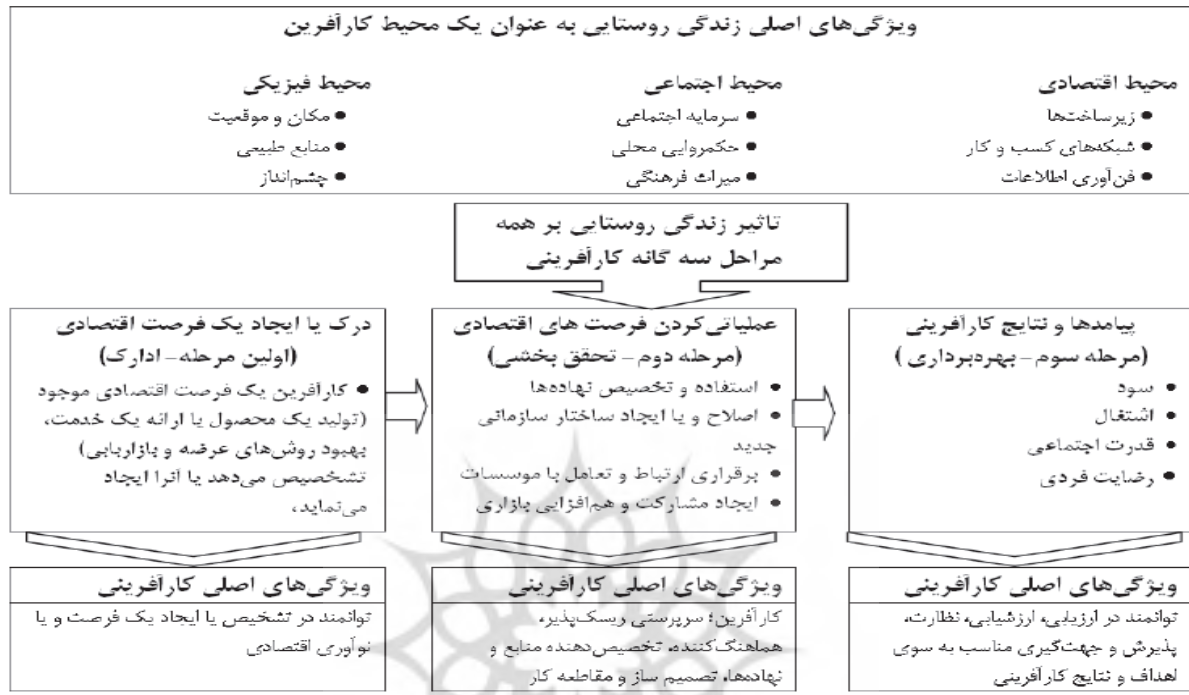
شکل ۳- ویژگی‌های اصلی زندگی روستایی به عنوان یک محیط کارآفرین

وابسته و رابطه میان آن‌هاست. از این رو، مهم‌ترین راهبردهای تقویت‌کننده کارآفرینی محلی عبارت‌اند از: ایجاد محیط و زمینه‌های پیش از کارآفرینی (ظرفیت‌سازی)، ایجاد زمینه خودباوری (توان‌مندسازی) و شدت‌بخشی به رشد از طریق