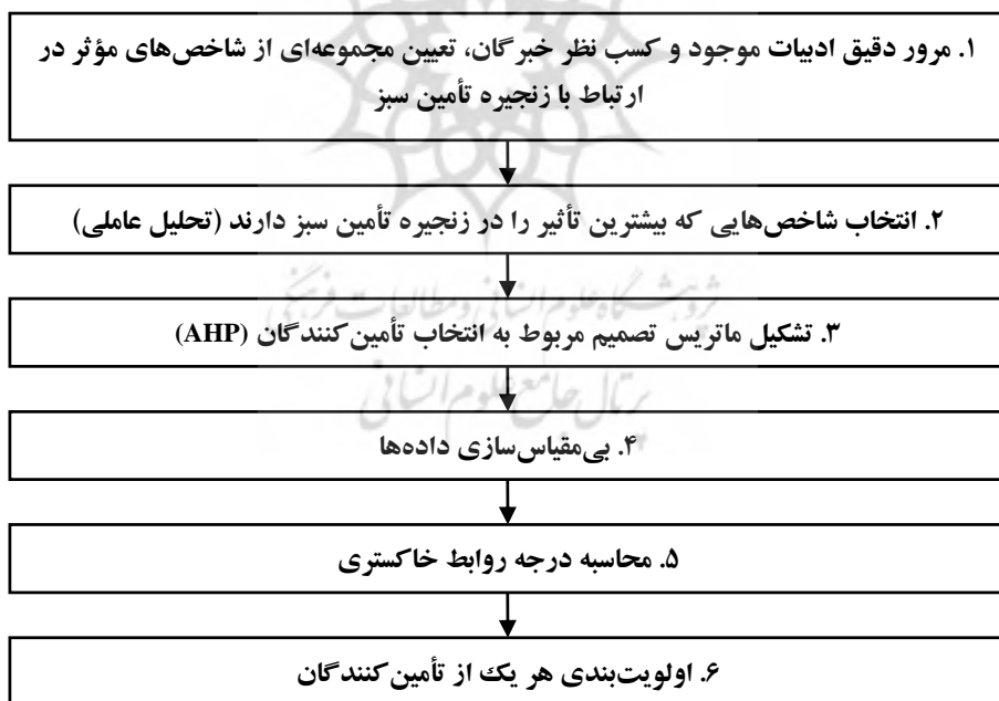
شکل ۱- مراحل اجرای تحقیق

از آنجا که هدف این مقاله ارائه مدلی برای سنجش مدیریت زنجیره تأمین سبز و رتبه‌بندی تأمین‌کنندگان است، ابتدا با مطالعه و بررسی متون علمی، ادبیات تحقیق تدوین شده، سپس اطلاعات لازم در مورد شرکت فولاد آلیاژی ایران جمع‌آوری گردیده است. با توجه به ادبیات تحقیق و اطلاعات در مورد شرکت، شاخص‌های زنجیره تأمین سبز استخراج شده است. این شاخص‌ها مبنای تهیه پرسش‌نامه قرار گرفته و پس از جمع‌آوری داده‌ها تحلیل عاملی اکتشافی انجام شده است، سپس به کمک نرم‌افزار لیزرل تحلیل عاملی تاییدی صورت گرفته و مدل نهایی تدوین شده و این شاخص‌های اصلی، در انتخاب تأمین‌کنندگان مورد استفاده قرار گرفتند. شکل (۱)، فرآیند اجرای پژوهش را نشان می‌دهد.