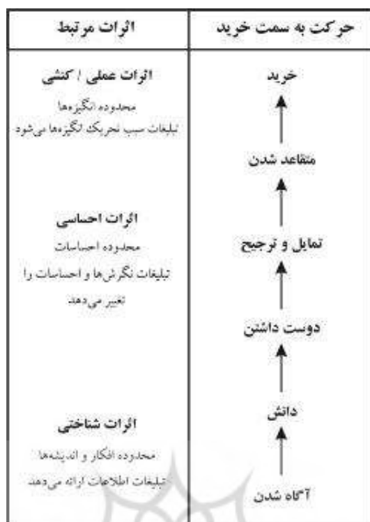
شکل ۱: مدل سلسله‌مراتب اثرات استیمر و لایویج (۱۹۶۱)

بر اساس پیشینه پیشنهاد شده که دل بستن مصرف‌کننده با یک تیم ورزشی نشان‌دهنده مرحله عاطفی مدل است، تعلق به یک تیم ورزشی به‌عنوان یک ارتباط روانی مصرف‌کننده به یک تیم ورزشی تعریف می‌شود (فانک و همکاران، ۲۰۰۰؛ گلادن و همکاران، ۱۹۹۸).