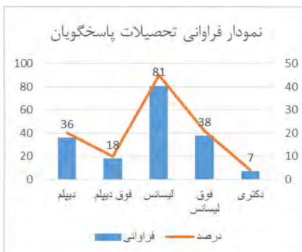
نمودار ۲: توزیع فراوانی تحصیلات پاسخگویان

را به دست می دهد. این ضریب نشان داد که چند درصد از تغییرات متغیر وابسته توسط متغیر مستقل تبیین می شود. ضرایب تعیین شده در چهارچوب مدل پژوهش ارائه شده است (شکل ۲).