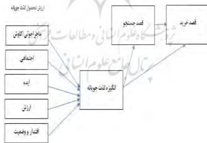
شکل ۱ - مدل پژوهش

مفهوم مصرف لذت‌باور مشخص می‌کند که افراد، بسیاری از محصولات را برای احساسات و تصویر ذهنی که محصول ممکن است داشته باشد، مصرف می‌کنند. این اصل از یک باور نشأت می‌گیرد که افراد بسیاری انواع محصول را تنها برای این که آنها می‌توانند کار را انجام دهند، خریداری نمی‌کنند؛ بلکه برای آنها مفهوم خاصی دارد؛ و محصولات لذت‌باور به‌طور کلی بر حسب احتمالات برای خودافزایی و