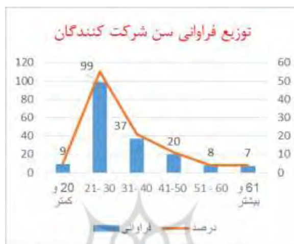
نمودار ۱: توزیع فراوانی سن شرکت‌کنندگان

تا ۴۰ سال برابر ۳/۵۱، میانگین نظرهای رده سنی ۴۱ تا ۵۰ سال برابر ۳/۵۶، رده سنی ۵۱ تا ۶۰ سال برابر ۳/۷۲ و در نهایت میانگین نظرهای رده سنی بالاتر از ۶۱ سال برابر ۳/۴۵ بوده است و تفاوت چندانی میان میانگین