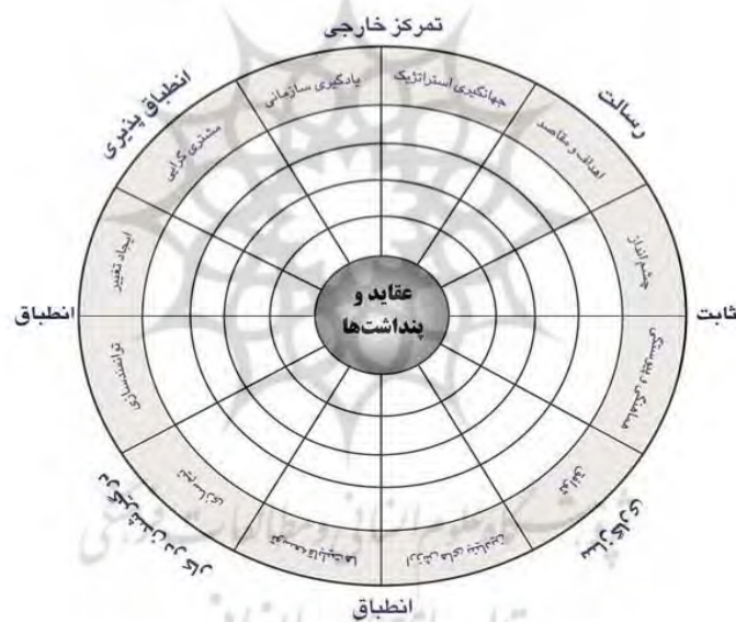
شکل ۱. مدل فرهنگ سازمانی دنیسون

به کار گرفته شده در این تحقیق و بیشتر تحقیقات انجام گرفته، براساس مدل فرهنگ سازمانی دنیسون است. دنیسون درباره فرهنگ سازمانی تحقیقات فراوانی انجام داد و دریافت که رابطه مناسب بین راهبرد، محیط و فرهنگ به دو عامل بستگی دارد: ۱. میزان ثبات یا تغییر محیط رقابتی؛ ۲. میزان توجه سازمان به امور داخلی یا خارجی. دنیسون (۲۰۰۰) فرهنگ سازمانی را متشکل از ترکیب چهار نوع فرهنگ می‌داند: فرهنگ مشارکتی، فرهنگ سازگاری، فرهنگ رسالت و فرهنگ انطباق. هر یک از این ویژگی‌ها به سه شاخص تقسیم می‌شوند که در مجموع، ۱۲ خرده‌مقیاس را تشکیل می‌دهند. او همچنین مدل خود را به چهار قسمت تقسیم کرده است که هر ربع شامل ۲۵ درصد است (شکل ۱).