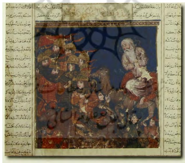
تصویر ۳) نگاره شاهنامه بزرگ ایلخانی با نقش فریدون گاوسوار، سده ۸ هـ.ق.

در شاهنامه بزرگ ایلخانی (دموت، حدود ۷۲۰-۷۵۰ هـ.ق) فراهم آمده در تبریز، شاهنامه ابراهیم سلطان (۸۱۶ هـ.ق) در شیراز و همچنین در گرشاسپ نامه متعلق به سال ۹۸۱ هـ.ق در قزوین فریدون سوار بر گاوی کوهان دار است (Abdullaeva-Melville, 8888: 66-77):