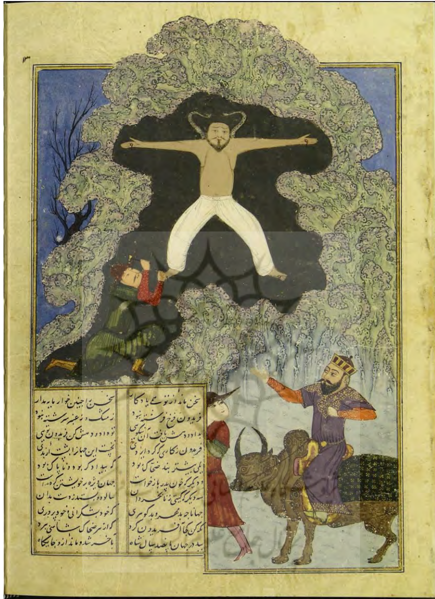
تصویر ۴) نگاره شاهنامه ابراهیم سلطان با نقش فریدون گاو سوار، سده ۹ هـ.ق.