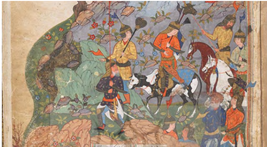
تصویر ۵) نگاره گرشاسپ‌نامه ۸۹۱ هـ ق با نقش فریدون گاوسوار.

دو نگاره مهم شاهنامه در تبریز و شیراز و همچنین نگاره گرشاسپ‌نامه در قزوین بیان‌گر آن است که نگارگران این سه مکتب از داستان گاوسواری فریدون در غرب ایران آگاه بوده و بر پایه سنت حماسی، سینه‌به‌سینه و نگارگری روایی، آن را وارد متن شاهنامه فردوسی و گرشاسپ‌نامه اسدی توسی کرده‌اند؛ با آن‌که در شاهنامه و گرشاسپ‌نامه هیچ اشاره‌ای به گاوسواری فریدون وجود ندارد. پی‌گیری پیشینه این سنت حماسی و نگارگری، ما را به سنگ‌نگاره‌های بابلی رهنمون می‌سازد. عداد، ۱ ایزد بابلی توفان، در سنگ‌نگاره‌ای متعلق به سده ۸ پ. م. در حالی ایستاده بر گاو نر تصویر شده است؛ در حالی که گریز از تندر در دست دارد (زیران ۲ - دلپورت، ۳ ۱۳۷۵: ۱۲۲). این سنگ‌نگاره می‌تواند کهن‌ترین پیش‌نمونه تصاویرهای گاوسواری فریدون باشد: