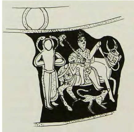
تصویر ۲) تاس با نقش فریدون گاوسوار، ۷۵۲ هـ.ق.

در شاهنامه بزرگ ایلخانی (دموت، حدود ۷۲۰-۷۵۰ هـ.ق) فراهم آمده در تبریز، شاهنامه ابراهیم سلطان (۸۱۶ هـ.ق) در شیراز و همچنین در گرشاسپ نامه متعلق به سال ۹۸۱ هـ.ق در قزوین فریدون سوار بر گاوی کوهان دار است (Abdullaeva-Melville, 8888: 66-77):