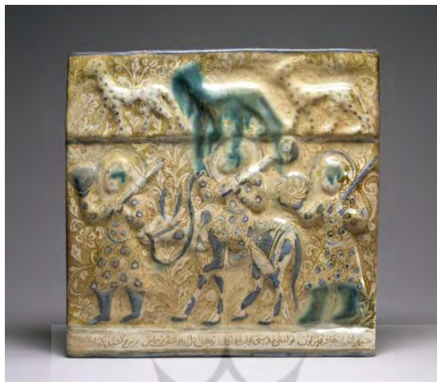
تصویر (۱) کاشی با نقش فریدون گاوسوار، سده ۷ هـ.ق.

بر روی تاسی متعلق به سال ۷۵۲ هـ.ق (احتمالاً تولیدشده در فارس) نیز فریدون در پیکر سواری ریش‌دار، درحالی‌که تاجی بر سر و گرزى گاوسر بر دست دارد، سوار بر گاوی کوهان‌دار تصویر شده است. ضحاک نیز با دستان بسته، بالاتنه عربان و سر برهنه درحالی‌که سر دو مار از شانه‌های وی بیرون زده، پشت سر فریدون است (برند، ۱۳۸۸: ۱۷۹، ۱۸۶):