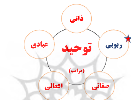
نمودار ۲: جایگاه توحید ربوبی در مراتب توحید

در این مرحله مرتبه‌ای از مراتب توحید انتخاب شده است که با مبحث تعالی رابطه مستقیمی دارد. از میان مراتب مختلف توحید، که هر یک به جلوه‌ای از ذات اقدس الهی اشاره دارد، «توحید ربوبی» که بر مالکیت و تدبیر الهی در هستی ناظر است، «مبنای تعالی» انتخاب شده است.