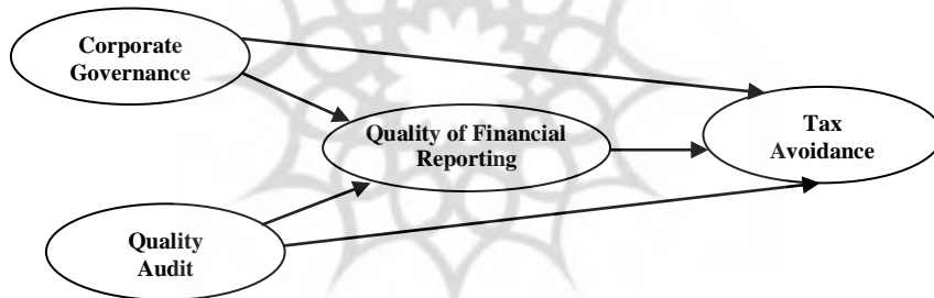
شکل شماره ۱. مدل مفهومی پژوهش

با توجه به موارد فوق، مدل مفهومی این پژوهش و ارتباط بین آنها، به شرح زیر است: