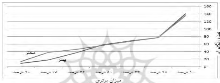
شکل ۳: تعداد رنگ‌واژه‌های برتر در کل اسلایدها با توجه به میزان برتری متناظر به تفکیک جنسیت

مقایسه تعداد اسلایدهای رنگی با میزان برتری متناظر آنها به تفکیک جنسیت آزمودنی‌ها نشان می‌دهد که کل تعداد اسلایدهای دارای برتری مشخص، تا ۵۰ درصد برتری تقریباً بر هم منطبق هستند اما پس از آن رفته‌رفته فاصله بین کل تعداد دختران و پسران زیاد می‌شود. تعداد اسلایدهای یک دختر ۸ یا ۹ ساله فارسی‌زبان در برتری ۷۵ درصد، معادل تعداد اسلایدهای یک فرد بالغ عرب‌زبان در همین میزان برتری است (الرشید، ۲۰۰۸: ۱۰). این تفاوت تعداد نمایانگر داشتن واژه‌های بیشتر برای رنگ‌ها در دخترهاست (نمودار ۳).