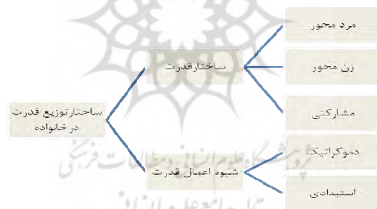
شکل ۱: ساختار توزیع قدرت در خانواده، ابعاد و مؤلفه‌های آن

خانواده مداری و پایبندی به نهاد مقدس خانواده امری است که اسلام آن را مورد تأکید قرار داده است، زیرا خانواده کانونی برای تربیت و تعلیم افراد بوده و می‌تواند آنها را در کنار هم نگه دارد. متلاشی شدن خانواده در جهان غرب، مفاسد اخلاقی و ارزشی و اجتماعی فراوانی را به دنبال داشته است. حفظ سبک زندگی اسلامی و پایبندی به آن مهمترین عامل در حفظ فرهنگ و ارزشهای اعتقادی قلمداد می‌شود. جایگاه دین در سبک زندگی و تأثیر آن بر نظام خانواده بسیار مورد توجه قرار گرفته و مطالعات متعددی در این زمینه انجام شده است. از جمله انصاریان در کتاب نظام تربیت در اسلام (۱۳۷۶) به نقش مهم پدر و مادر در خانواده و تربیت افراد صالح و شایسته در سایه آنها؛ و صانعی در کتاب پژوهشی در تعلیم و تربیت در اسلام (۱۳۷۸) به هدفهای تربیتی اجتماعی و ویژگیهای انسان از نظر تعلیم و تربیت و عامل تشویق و تنبیه در پیشرفت و عدم پیشرفت فرد؛ و مهدوی کنی در کتاب دین و سبک زندگی (۱۳۸۷) به جایگاه دین در سبک زندگی و تأثیر آن بر نظام خانواده و شهید مطهری در کتاب تعلیم و تربیت در اسلام (۱۳۸۸) به عوامل مهم در تربیت از جمله عبادت، تفکر، جهاد، ازدواج، کار، محبت و ... اشاره نموده اند. از آنجا که نهاد خانواده و ساختار توزیع قدرت در آن به عنوان متغیر مستقل مهم در این پژوهش مورد توجه قرار گرفته است، لذا ابعاد و مؤلفه‌های آن به شرح شکل ذیل نشان داده می‌شود.