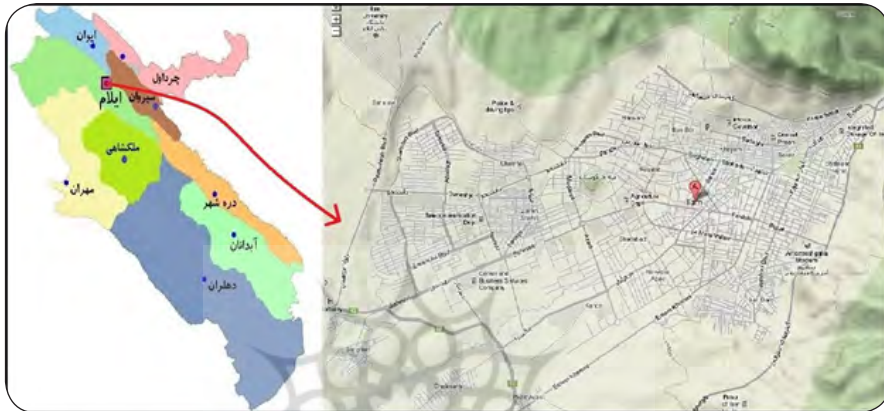
تصویر شماره (۱): نقشه استان و شهر ایلام

سابقه تاریخی منطقه و تصویب فرهنگستان ایران، «ایلام» نامیده شد» (یعقوبی و یعقوبی، ۱۳۸۹: ۱۳۴). این شهر «در داخل یک دشت میان کوهی واقع شده و از اطراف به وسیله ارتفاعات محصور گردیده است» (انصاری لاری و همکاران: ۱۳۹۰: ۱۴). «در دامنه این ارتفاعات، جنگل‌هایی وجود دارند که از یک طرف، موجب زیبایی منطقه شهری و از طرف دیگر باعث ایجاد آب و هوای معتدل کوهستانی در شهر ایلام شده است» (مهندسین مشاور طرح و آمایش، ۱۳۷۳: ۱۱).