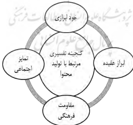
نمودار ۱. گنجینه تفسیری مرتبط با تولید محتوا

منظور از گنجینه تفسیری شبکه‌های اجتماعی، برگرفته از مفهوم گنجینه تفسیری است که در روان‌شناسی گفتمانی و توسط وترل و پارتز مفهوم‌پردازی شده است؛ و نظام‌های ذهنی و معنایی جوانان درباره تولید و مصرف متون و مطالب در شبکه‌های اجتماعی را بازتاب می‌دهد (پوتر و وتریل، ۱۹۹۸ به نقل از فلیک، ۱۳۸۲: ۷۸). این مفاهیم، صورت‌های ذهنی و معنایی هستند، که به واسطه زبان و در خلال گفت‌وگو با پژوهشگر بر ساخته شده‌اند. بنابراین مقوله‌های ذیل اساساً ملاحظات نظری هستند، که در خلال پژوهش بازآفرینی، اصلاح و جرح و تعدیل و در نهایت تثبیت شده‌اند؛ اما آنچه دفاع از آن‌ها را میسر می‌سازد مبتنی بودن آن‌ها بر پایه شواهد به دست آمده از مشارکت‌کنندگان و داده‌های به دست آمده در طول کار میدانی است. تفکیک گنجینه تفسیری شبکه‌های اجتماعی به گنجینه تفسیری مرتبط با تولید محتوا و گنجینه تفسیری مرتبط با مصرف محتوا، صرفاً برساختی نظری است؛ چراکه اساساً خود مشارکت‌کنندگان، به صورت عملی در گفته‌های خود تمایزی بین تولید محتوا و مصرف محتوا قائل نبوده‌اند. از این لحاظ و برای روشن ساختن گنجینه تفسیری شبکه‌های اجتماعی، ابتدا یافته‌های مرتبط با تولید محتوا پیاده‌سازی، کدگذاری و تفسیر شده‌اند و سپس این فرایند بر روی داده‌های مربوط به مصرف محتوا نیز به‌طور جداگانه صورت گرفت. این تمایز همچنین، به این دلیل است که تولید و مصرف محتوا، اصلی‌ترین فعالیت - بنا بر تعریف اسپرادل - از فعالیت‌های جوانان در شبکه‌های اجتماعی هستند.