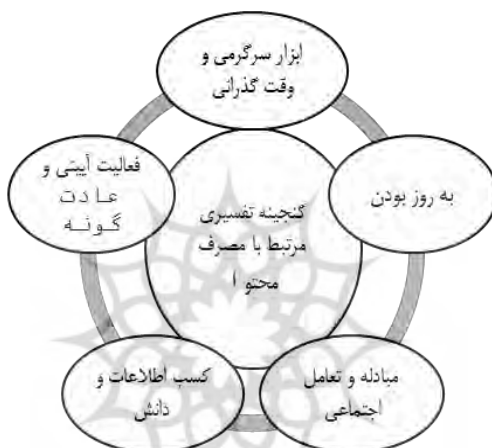
نمودار ۲. گنجینه تفسیری مرتبط با مصرف محتوا

تفسیر جوانان از مصرف محتوا عمدتاً در ذیل چهار مفهوم جای می‌گیرد. جوانان مصرف محتوا را عمدتاً وسیله‌ای برای سرگرمی و وقت‌گذرانی، به‌روز بودن و مبادله اجتماعی در نظر می‌گیرند. همچنین بسیاری از جوانان در تفسیر تجربه مصرف محتوا آن‌را بخشی از عادات استفاده خود می‌دانستند، به این معنا مصرف محتوا برای برخی از جوانان حالت آئینی و عادت‌وار به خود دارد.