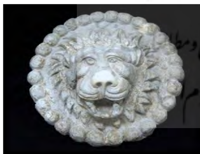
تصویر ۴- سرمشهد، نبرد بهرام دوم با شیر

۳- آناهیتا: مجلس باشکوه تاج‌ستانی پیروز اول در تاق بستان یا صحنه‌ی انتهایی تاق بزرگ، علت وجودی این ایوان مجسمه‌دار است. زیرا در خود طاق روایت ساسانی دیهیم بخشی که در قرن اول حکومت ساسانی به دفعات نمایش داده‌شده دیده می‌شود. در این مکان سه پیکره