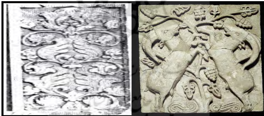
تصویر ۱۴- شوش، درخت زندگی.

بررسی نقش درخت زندگی در ایران و هند: همان‌طور که اشاره شد درخت زندگی مقدس‌ترین درخت در میان ملل است. هر ملتی اعتقادات خاص خود را در مورد این درخت دارد. درخت زندگی در ایران دارای جایگاه مهم و والایی بوده است، چنانچه برای به دست آوردن میوه آن که جاودانی می‌آورد بایستی به شناخت کافی دست یافت تا از میوه آن بهره‌مند شد و به جاودانگی رسید این شناخت راگاهی به شناخت قلبی و معرفتی معنا کرده‌اند. در هند برخلاف ایران درخت مقدس بیشتر جنبه پرستشی و تقدس دارد و دارای نیرو و جریانات انرژی الهام بخش بوده است که باعث می‌شود از آن طریق به شهود و مکاشفات خود و محیط اطراف دست یابند.