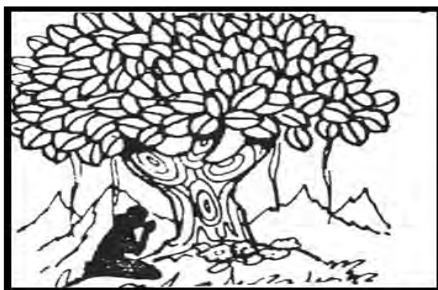
تصویر ۱۵- نقش درخت مقدس در نزد هندیان، مأخذ (منصوری، ۱۳۸۱: ت ۱۲۶)