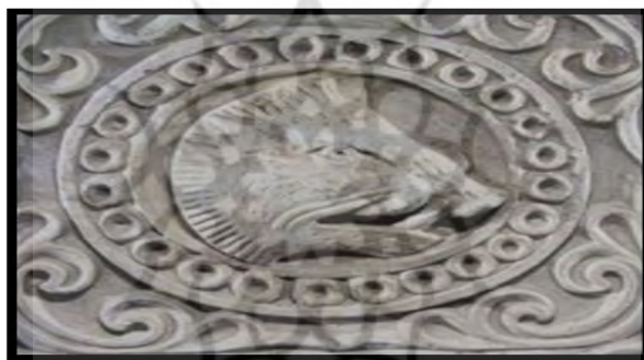
۲- حصار، نقش سر گراز. مأخذ (Flandin and cost, 1858:p10) مأخذ: (آرشیو موزه ملی)