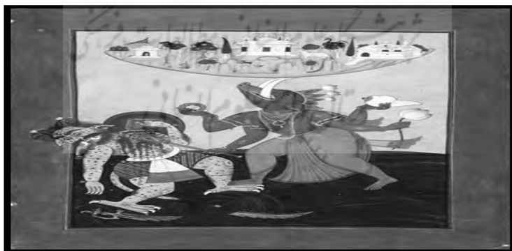
تصویر ۳- واراها (گراز) تجلی سوم ویشنو، با آرواره قدرتمندش زمین را از چنگ اهریمنان نجات می‌دهد.