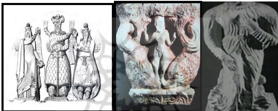
تصویر ۸- قلعه یزدگرد، تندیس آفرودیت

ایام نپات (خدای آب هندیان) جزو خدایان بسیار فرعی و داهاست. با در نظر گرفتن ریشه مشترک هندو آریایی، احتمالاً ایام نپات را می‌توان همان آناهیتا یا ایزد آب اوستا دانست. اما گذشت زمان و فاصله‌ی ایجاد شده میان دو تمدن، باعث پدید آمدن تفاوت‌های موجود شده که از جمله‌ی آن ایزد آب در ایران به عنوان ایزدبانوی با جایگاه والا شناخته شده اما خدای هندیان با جایگاه بسیار پایین‌تر نسبت به همتای ایرانی خود در ودا دارای توصیفی نرینه و پسرانه است. لیکن با وجود تفاوت‌ها و اشتراکات، این ایزد در هند به حاشیه رانده شده؛ اما در ایران یکی از خدایان مهم و تأثیرگذار در زندگی مردمان آن روزگار است. خیر و برکت و حاصلخیزی نقطه اشتراک ایزد آب در این دو تمدن است که باعث شده احتمال یکی بودنشان در زمان همزیستی‌شان (مهاجرت آریاییان) قوت گیرد.