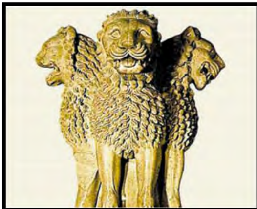
تصویر ۶- سر ستون سرنات، عهد آشوکا