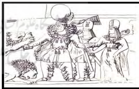
تصویر ۵- حاجی‌آباد، قطعه گچ‌بری سر شیر. مأخذ: (Flandin and cost, 1858:p186)