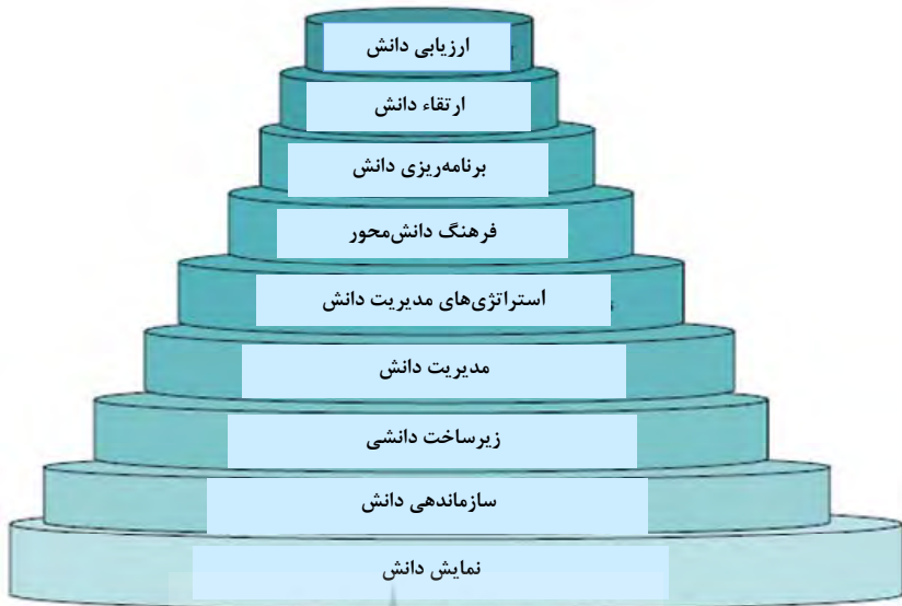
شکل ۲. مدل نهایی پژوهش