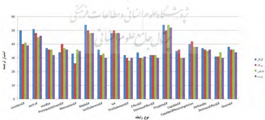
شکل ۱. نمودار مربوط به کیفیت ترجمه به تفکیک موتور جستجو و رابطه (حداکثر امتیاز ۶۰)