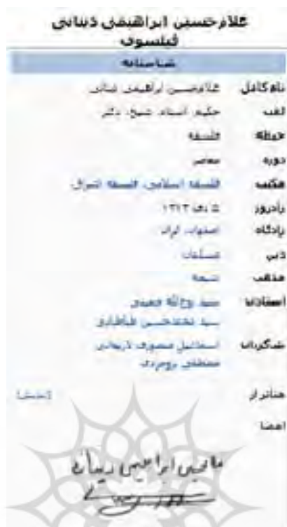
شکل ۲. نمونه‌ای از یک جعبه اطلاعات ویکی‌پدیا