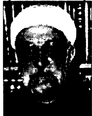
محمد مجتهد شبستری