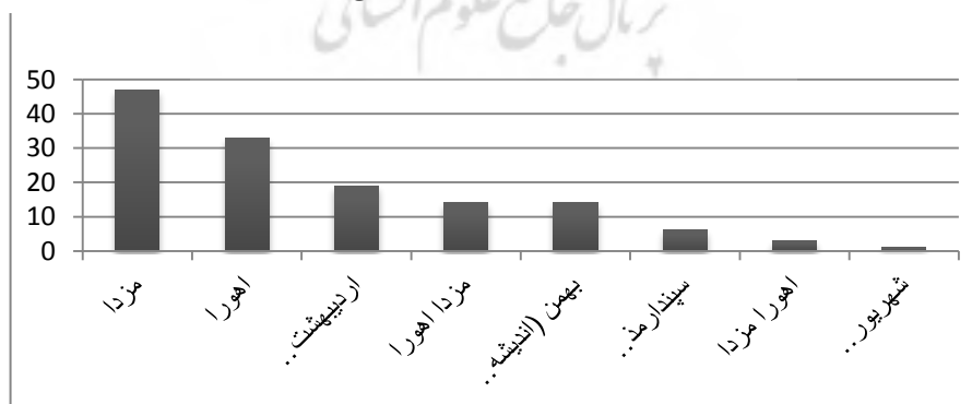
نمودار شماره ۱: مخاطب نیایش در گات‌ها