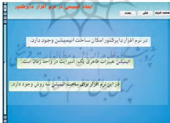
شکل ۱: نمونه‌ای از روش آموزشی مبتنی بر هوش زبانی در محتوای الکترونیک

برای ساخت این محتوای الکترونیک مطابق روش پیشنهادی لازیر ۲ و توسط یی‌دونگ و همکاران (۲۰۱۱) به صورت زیر عمل شد: در تهیه محتوا برای انطباق با هوش زبانی، از منابع متنی و متن خوانده شده استفاده شد.