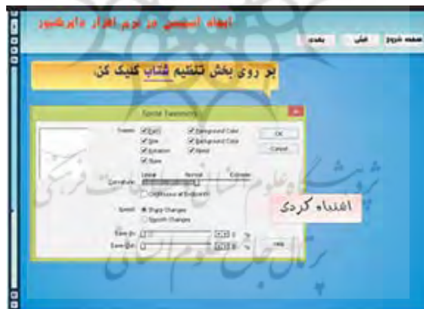
شکل ۳: نمونه‌ای از روش آموزشی مبتنی بر هوش حرکتی-جسمانی در محتوای الکترونیک

برای تطابق با هوش حرکتی- جسمانی، از شبیه‌سازی عملیات، مجموعه دستورات تعاملی راهنمایی‌کننده برای یادگیری و طراحی عملیات با ماوس و صفحه کلید بر طبق محتوای یادگیری استفاده شد.