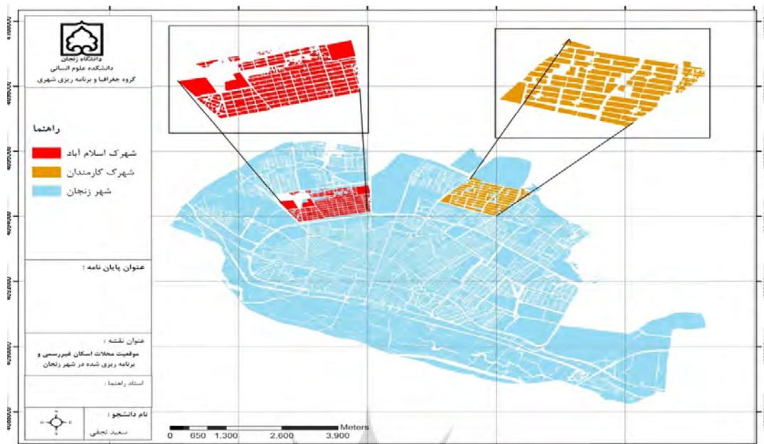
شکل ۱: موقعیت محدوده مورد مطالعه در شهر زنجان (نقشه ۲۰۰۰: ۱ شهر زنجان، ۱۳۹۳)