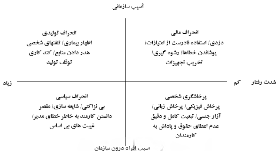
شکل ۱. طبقه‌بندی رفتارهای انحرافی

انحرافی را توجیه می‌نماید، رویکرد استرس - نامتعادلی - جبران است. از مفروضات اصلی این رویکرد این مفروضه اهمیت بسیاری دارد که عوامل استرس آور در هر یک از قالب‌های مطرح نظیر تعارضات میان فردی، افراد را از حالت تعادل هیجانی، شناختی و رفتاری خارج می‌کند. این خارج شدن از حالت تعادل برای انسان‌ها ماهیت انگیزشی دارد. به این شکل که افراد با تجربه استرس و فقدان تعادل ناشی از آن نظیر فرسودگی شغلی به تکاپو می‌افتند تا تعادل از دست رفته را بازگردانی کنند. این بازگردانی به صورت کاهش تمایلات رفتاری مثبت نظیر رفتارهای مدنی سازمانی و خلاقیت و افزایش تمایلات رفتاری منفی نظیر رفتارهای انحرافی نمود می‌یابند (گل پرور و همکاران، ۱۳۹۲). گل پرور و همکاران (۱۳۸۹). در پژوهشی روی کارکنان شرکت ذوب آهن نشان دادند که بین دو متغیر فرسودگی هیجانی و رفتار انحرافی رابطه مثبت و معناداری وجود دارد. در پژوهشی دیگر روی دو مجموعه صنعتی در اصفهان نیز مشخص شد بین فرسودگی هیجانی و رفتار انحرافی رابطه مثبت و معناداری وجود دارد (گل پرور و همکاران، ۱۳۹۱).