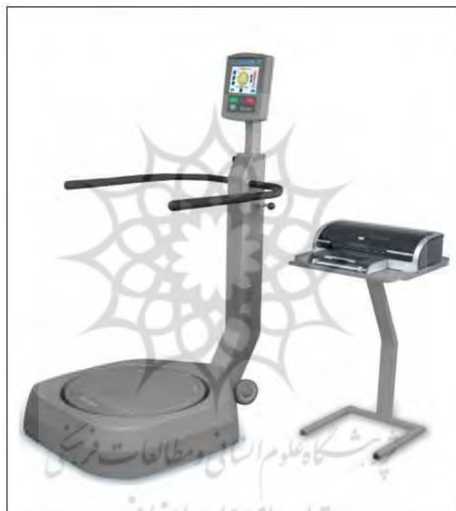
شکل ۱. دستگاه سنجش تعادل بایودکس

از دستگاه اندازه‌گیری پایداری قامت ساخت شرکت بایودکس آمریکا برای سنجش کنترل قامت استفاده شد. این دستگاه قابلیت تنظیم پایداری از سطح ۱ تا ۱۲ و ۲۰ درجه تغییر زاویه نسبت به سطح افقی در تمام جهات را دارد. روایی ۲ دستگاه تعادل سنج بایودکس در مطالعات مختلف تأیید شده است (۲۷، ۱). پایایی ۳ (تکرارپذیری) دستگاه تعادل سنج بایودکس نیز در مطالعات مذکور تأیید شده است.