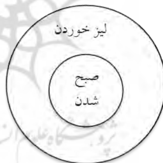
شکل ۱- نمایش مفاهیم دریافتی صریح و ضمنی از فعل شخشدن

سبب را به طور ضمنی مطرح نموده است. فعل ساده «شخشدن» با معنای صریح «لیز خوردن» در قالبی کاملاً انتزاعی و خیالی به شب اسناد داده شده است و ذهن را از حوزه معنی صریح لغوی به سمت معنی ضمنی «صبح شدن» هدایت می‌کند. در نتیجه، به نظر می‌رسد مفهوم صریح «لیز خوردن» منظور نظر نویسنده نبوده است و در اصل، القای مفهوم ضمنی آن که بعد از این معنی به ذهن متبادر می‌شود مقصود نویسنده است. «جان فیسک (John Fiske) معتقد است دلالت صریح در هر متن، پندار و توهمی است که با ورود به مرحله تلویحی و غیر صریح بر ما روشن می‌شود؛ یعنی ما در هر برخورد خویش با یک متن گمان می‌کنیم که معنای آن را دریافته‌ایم اما با تأمل بیشتر درمی‌یابیم که معنای صریح و دلالت مستقیم ناشی از دال، چیزی جز پندار نبوده است. او در نوشته‌های بعدی خود، مدعی شد که دلالت صریح، متضمن معنای اصلی و اولیه متن نیست بلکه می‌توان گفت معنای مزبور، آخرین دلالت ضمنی است. شاید بتوان گفت که دلالت ضمنی یا التزامی، قابلیت در زبان است که معنای صریح را در خود دارد؛ یعنی توهم دلالت صریح را در ما ایجاد می‌کند» (ضیمران، ۱۳۸۳: ۱۲۲) ° (۱۱۹)؛ بنابراین برخلاف پوسته صوری، مفهوم ضمنی (صبح شدن) مراد است که بعد از کنار زدن معنی ظاهری و صریح آن (لیز خوردن) به ذهن تداعی می‌شود. در حقیقت معنی اصلی مورد نظر چیزی است که در بطن معنی صریح نهفته است (شکل ۱).