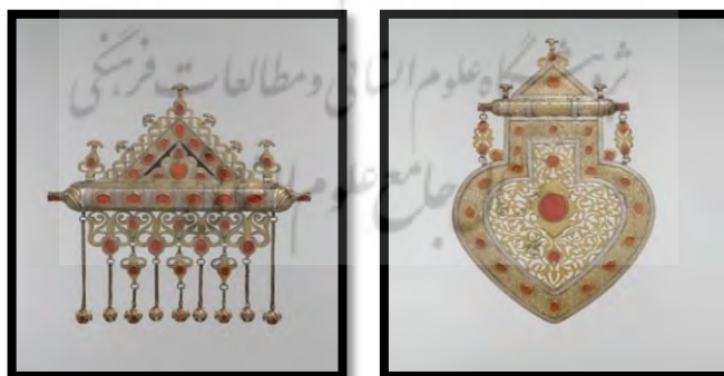
تصاویر ۵ و ۶: نمونه‌هایی از زیورآلات شاخص قوم ترکمن