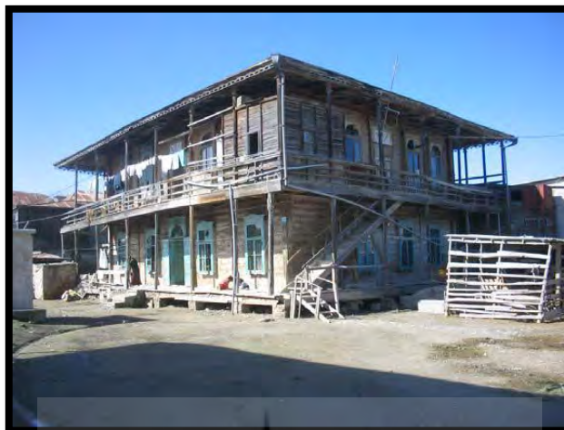
تصویر ۲: نمونه‌ای از بنای تام در گمیشان (رستم زاده و ایلکا، ۱۳۸۷)

در دهه دوم قرن حاضر، خانه‌هایی در حول و حوش بندر ترکمن ساخته شد که محل اسکان دائمی ترکمن‌های سواحل‌نشین آن منطقه شد. این‌گونه از بناها همان خانه‌های چوبی است که با عنوان «تام» از آنها یاد می‌شود. امروزه ترکمن‌های مناطق ساحلی، این اصطلاح را درباره هر نوع بنایی که ساخته می‌شود، به کار می‌گیرند. تام معمولاً یک یا دو اتاقه است و درب آن رو به جنوب باز می‌شود و قبل از ورود به اتاق، ایوان کوچکی قرار دارد که در گوشه آن، ظرف آب و وسایل ضروری قرار می‌گرفته است. (همان: ۱۳۵)