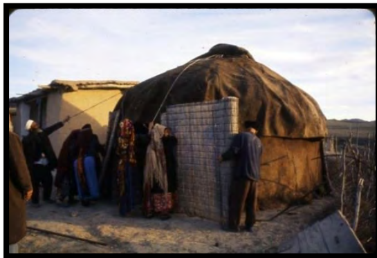
تصویر ۱: بنای آلاچیق (دیواره بیرونی از نی)

آلاچیق‌های ترکمن که در زبان ترکمنی «اوی» ۱ (به معنی خانه) و به روایتی دیگر «یورت» ۲ نامیده می‌شود، مهم‌ترین و شاخص‌ترین بنای زیستی قوم ترکمن را از گذشته‌های دور (از دوره بیابانگردی این قوم) تا چند دهه قبل تشکیل می‌داده است. «اوی» اسکلت چوبی متحرک و قابل حملی است که با «نمد» و «قامیش» ۳ پوشانده می‌شود. درب این بنا به طور معمول در سمت جنوب و مخالف باد قرار می‌گیرد. به هنگام تابستان دور آن را با گلیم یا نمد می‌پوشاندند و در زمستان پوشش ضخیم‌تری به نام «کشمه» به کار می‌رفت (عابدینی، ۱۳۸۵: ۴۲-۳۸). ساخت «اوی» و مراسم خاص برپایی و تزیینات داخلی آن، نوع خاصی از زندگی و فرهنگ ترکمن‌ها را نشان می‌دهد. کار برپایی این بنای ترکمنی به عهده زنان است و قبل از اینکه «تاریم» ۴ ‌ها را بگذارند، آیین‌هایی همچون شلیک تفنگ، «ذکرالله» و دادن هدایا به اجرا درمی‌آید. اوی کوچک‌ترین بخش از نظام اجتماعی ترکمن‌هاست و با قرار گرفتن چند اوی در کنار یکدیگر «اوبه» به وجود می‌آید که اغلب افراد ساکن در یک «اوبه» با یکدیگر نسبت خویشاوندی دارند. (رستم‌زاده و ایلکا، ۱۳۹۱: ۱۳۷)