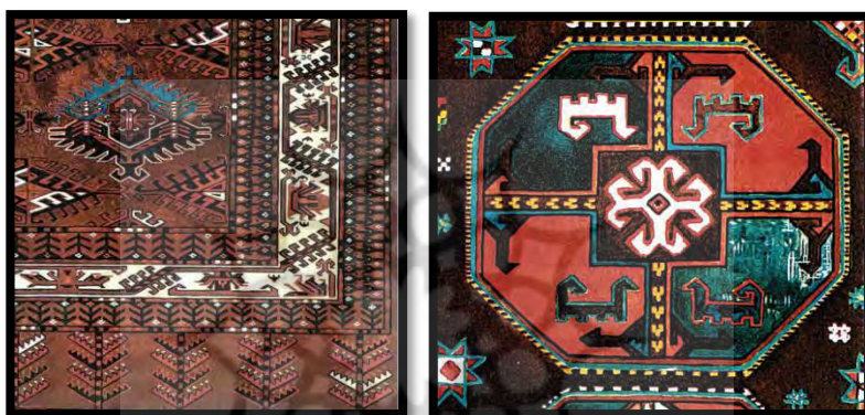
تصاویر ۳ و ۴: جزئیاتی از نقش و رنگ دست‌بافته‌های ترکمن.

در کل، هنرهای دستی قوم ترکمن را می‌توان به سه گروه دست‌بافته‌ها، هنرهای فلزی و هنرهای چوبی تقسیم‌بندی کرد. فرش، قالیچه، پشته، نم‌د و سوزن‌دوزی‌های زیبای ترکمن، هنرهایی شناخته شده در خارج از مرزهای ایران به شمار می‌آیند. زیورآلات قوم ترکمن، جزو برترین هنرهای فلزی این قوم در ایران محسوب می‌شود. این گونه از آثار علاوه بر کاربرد بسیار از گذشته تا به امروز، نقش اعتقادی برای شخص استفاده‌کننده آن نیز داشته است. در مورد هنرهای چوبی این قوم نیز می‌توان به اسکلت چوبی آلاچیق و برخی وسایل مورد استفاده در خانه اشاره کرد.