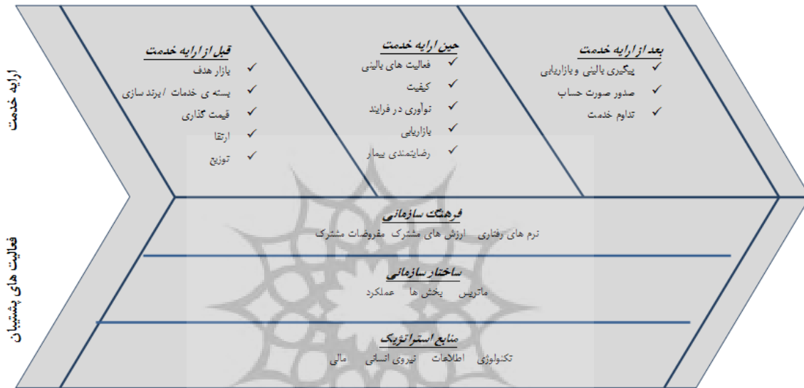
شکل ۱: زنجیره ارزش در سازمان‌های بهداشتی درمانی

قالب زیر سیستم پشتیبان از زیر سیستم ارابه خدمت حمایت کرده و با ایجاد کارایی سازمانی، جو حمایتی و منابع مورد نیاز مثل منابع مالی نیروی انسانی ماهر، سیستم های اطلاعاتی و تجهیزات و تسهیلات مناسب به تولید و ارابه مراقبت های بهداشتی درمانی کمک می‌کنند (۲۳، ۱۵). این زیر سیستم‌ها در شکل ۱ آورده شده است.