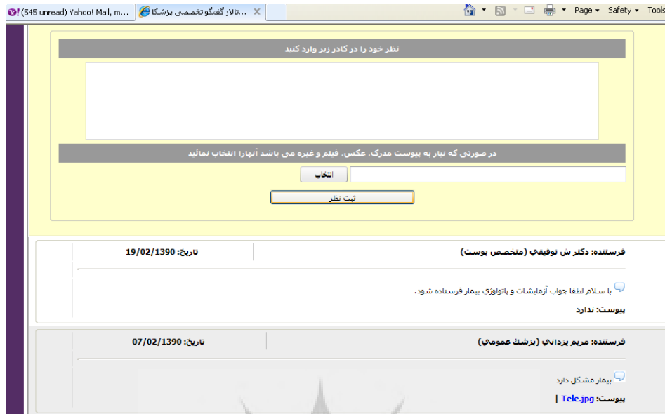
تصویر ۳: کنترل وضعیت بیمار

قبلی را به خاطر ندارد از وی درخواست شد که حال تشخیص بیماری را بر اساس شرح حال و تصاویر دیجیتال ثبت شده مشخص کند. اینکار بر روی حدود ۹۱ بیمار انجام شد. بعد از اتمام کار، تشخیص اولیه که با روش حضوری گذاشته شده بود با تشخیص‌هایی که با روش غیرحضوری بعد از دو ماه گذاشته شده بود با هم مقایسه گردید. داده‌های گردآوری شده توسط پرسش‌نامه توسط نرم افزار SPSS نسخه ۲۰ مورد تحلیل قرار گرفت.